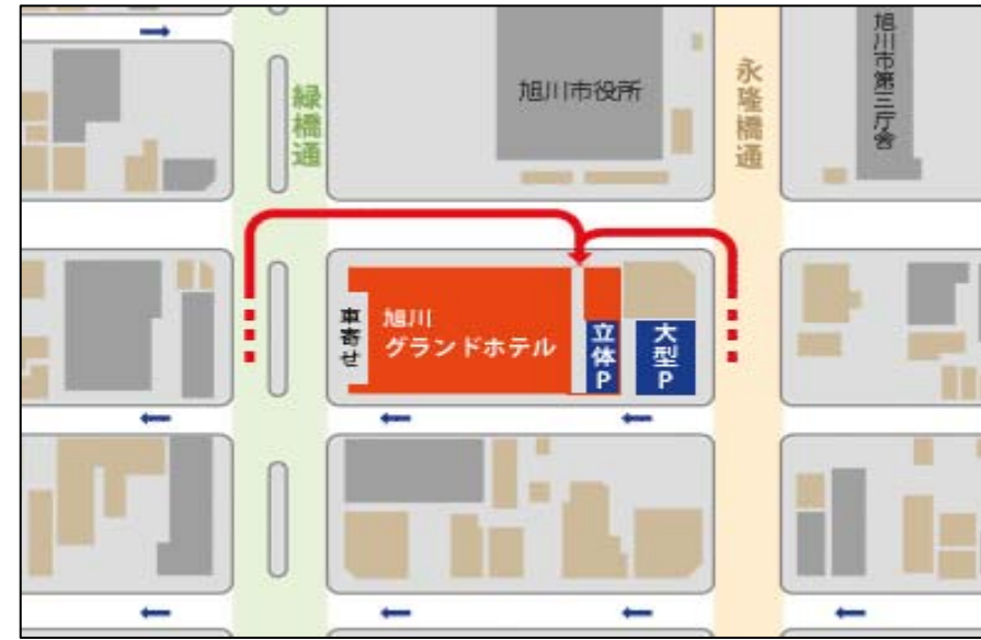
一般車両は矢印に沿って立体駐車場へお入りください

旭川グランドホテル2F 北辰の間 旭川市6条通9丁目 TEL.0166-24-2111